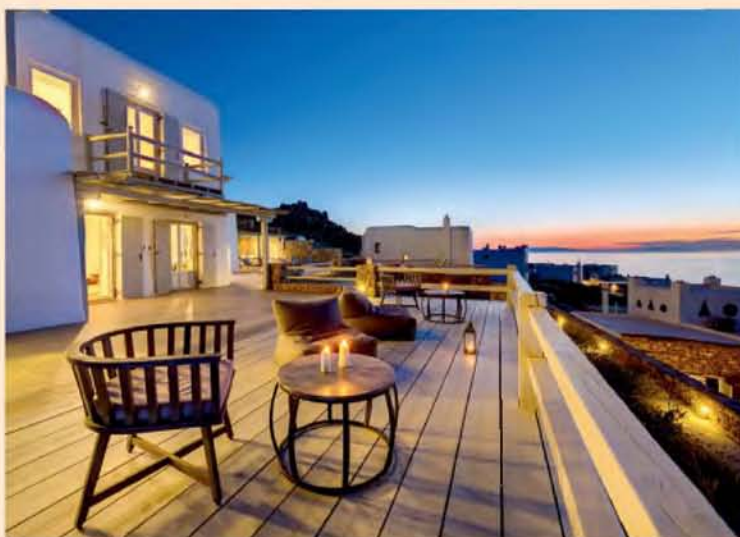
Στην κατηγορία των πολυτελών κατοικιών (αξίας άνω των 2 εκατ. ευρώ), πρόσφατη ανάλυση της Greece Sotheby's International Realty σημειώνει ότι κατά την περίοδο από την 1η Μαρτίου μέχρι και τις 22 Απριλίου του 2026 παρατηρήθηκε αύξηση κατά 22% της αξίας των νέων συμφωνημένων αγοραπωλησιών.