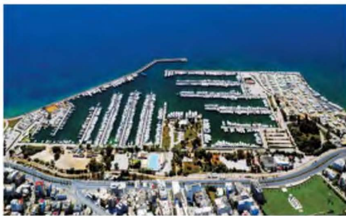
Με αιχμή του δόρατος την ανάπτυξη της Μαρίνας Αλίμου, η Ελλάκτωρ στρέφεται σε επενδύσεις με σταθερές αποδόσεις.

Η στροφή στα ακίνητα αποτυπώθηκε και στις επιδόσεις του συγκεκριμένου κλάδου. Τα έσοδα αυξήθηκαν στα 18,0 εκατ. ευρώ το 2024, ενώ τα EBITDA διαμορφώθηκαν σε κέρδη 4,5 εκατ. ευρώ, έναντι ζημιών κατά την προηγούμενη χρήση. Καθοριστικό ήταν η συμβολή της Μαρίνας Αλίμου, η οποία