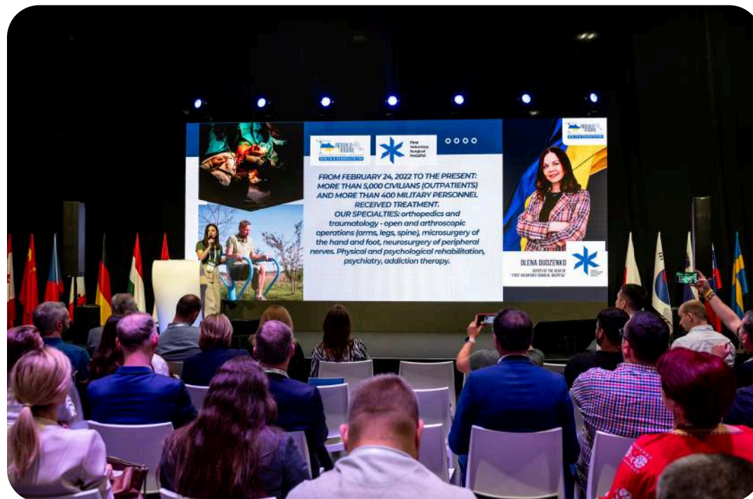
Presentation of real projects from communities and hospitals

ReBuild Health offers a concrete tool – the « Communities Marathon » In 2025, 12 Ukrainian municipalities presented their projects to donors