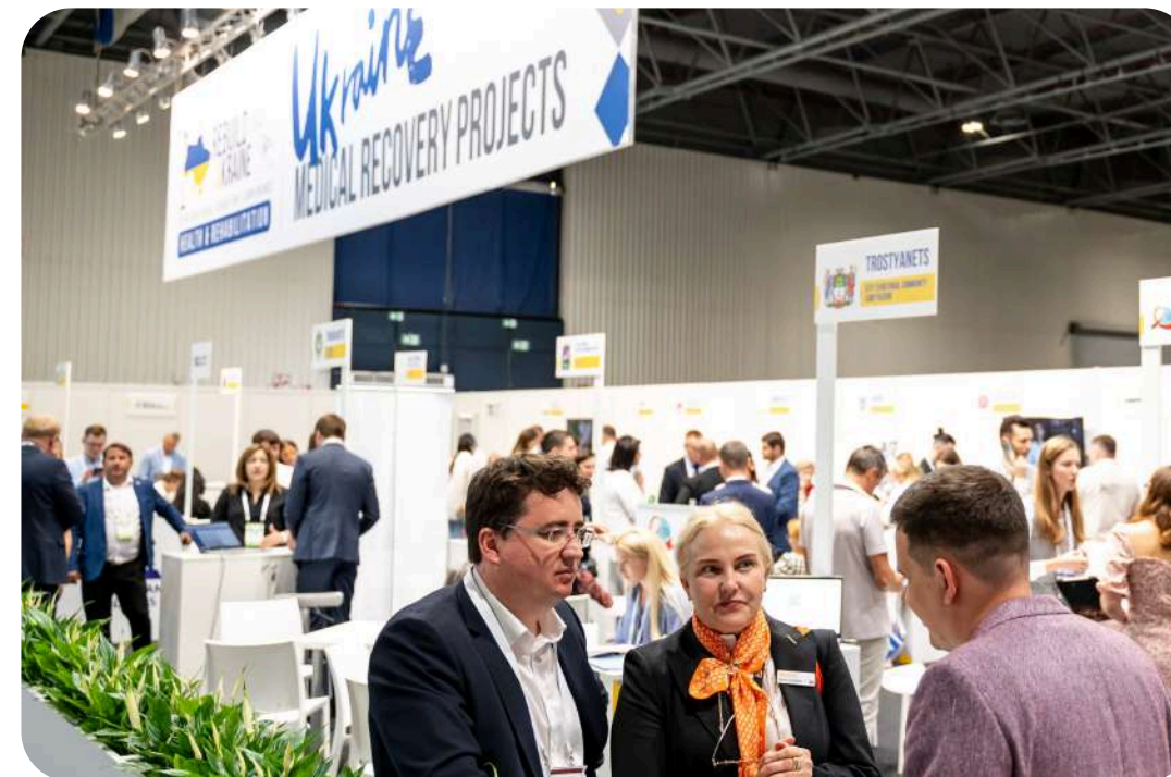
Direct pitching to donors