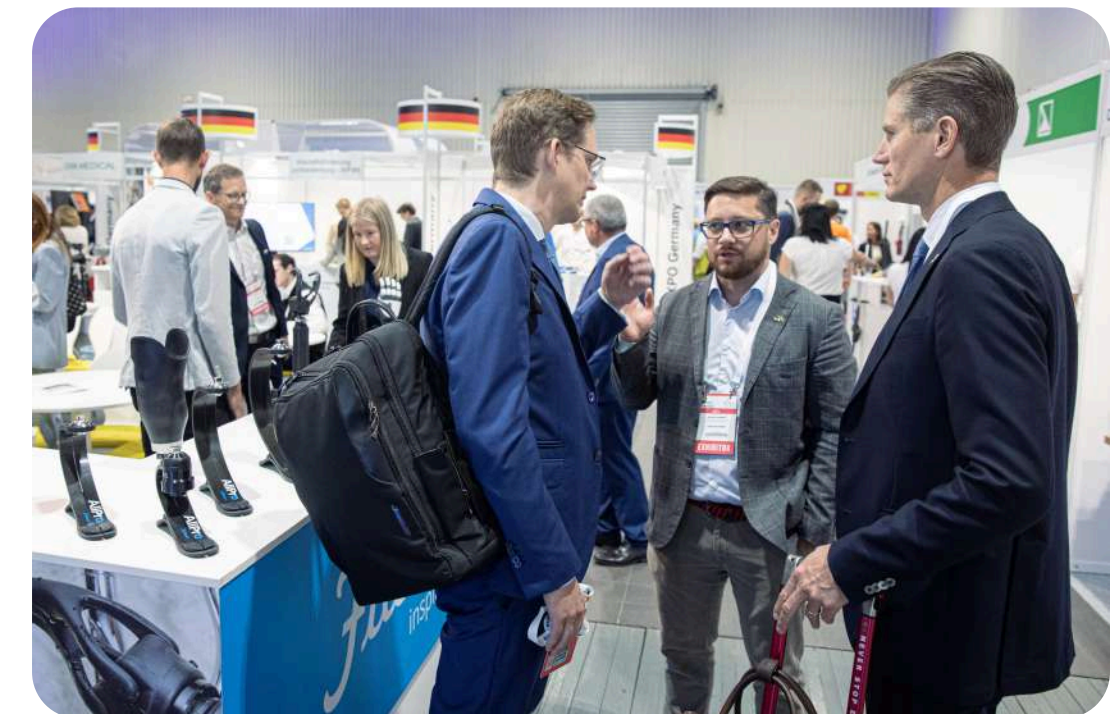
Discussions on grants and funding for 2026