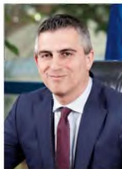
Επιστολή προς τον υπουργό Υποδομών και Μεταφορών, Χρήστο Δήμα, έστειλαν οι εργοληπτικές οργανώσεις.

Υπό αυτές τις συνθήκες, οι εργοληπτικές οργανώσεις κάνουν