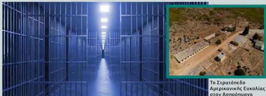
Το Στρατόπεδο Αμερικανικής Ευκολίας στον Ασπρόπυργο

Το υπερσύγχρονο συγκρότημα θα φιλοξενεί περίπου 2.016 κρατούμενους και 1.044 εργαζόμενους. Θα περιλαμβάνει τέσσερα αυτόνομα Κέντρα Κράτησης (δύο ανδρών,