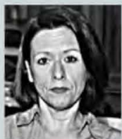
Γράφει η Ρεγγίνα Σαβούρδου

Τ ο υπουργείο Περιβάλλοντος και Ενέργειας (ΥΠΕΝ) ενέκρινε τους περιβαλλοντικούς όρους για το εμβληματικό έργο του νέου σωφρονιστικού καταστήματος στον Ασπρόπυργο, που θα συνοδευτεί από τη μετεγκατάσταση των φυλακών Κορυδαλλού. Το έργο με προϋπολογισμό περίπου 765 εκατ. ευρώ με ΦΠΑ θα υλοποιηθεί μέσω Σύμπραξης Δημόσιου και Ιδιωτικού Τομέα (ΣΔΙΤ) με μέγιστη διάρκεια σύμβασης τα 30 έτη. Φορέας υλοποίησης είναι το υπουργείο Προστασίας του Πολίτη, ενώ τη διαδικασία υποβολής δεσμευτικών προσφορών, που αναμένεται εντός του καλοκαιριού, διενεργεί η μονάδα PPF του Υπερταμείου. Ισχυρό ενδιαφέρον για τη διεκδίκηση έχουν εκπληώσει κορυφαίοι κατασκευαστικοί όμιλοι της χώρας, ξεπερνώντας τις αρχικές τοπικές αντιδράσεις.