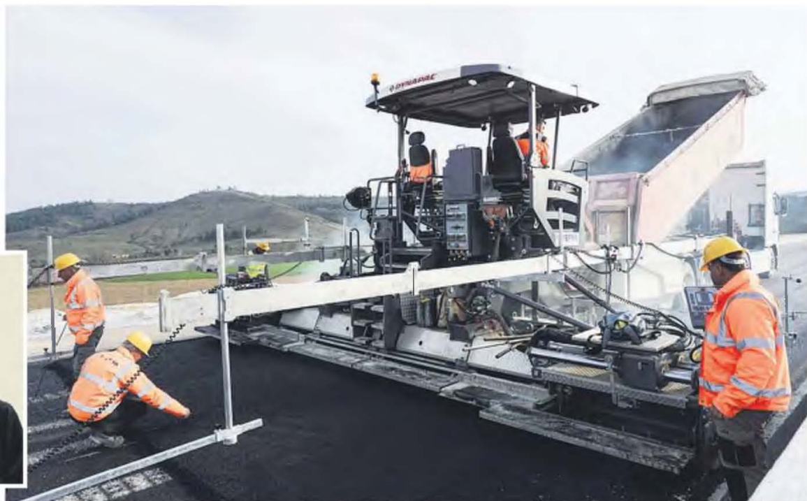
Η ΓΕΚ ΤΕΡΝΑ έχει αναδειχθεί σε έναν από τους σημαντικότερους επενδυτές στις ελληνικές υποδομές, τόνισε ο επικεφαλής, Γιώργος Περιστερίης.