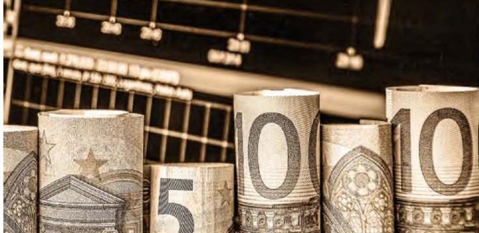
Οι υπουργοί Ανάπτυξης, Τόκης Θεοδωρικάκος, και Οικονομικών, Κυριάκος Πιερρακάκης

το ανώτατο όριο αρχικού κεφαλαίου για τα δάνεια και τις πιστωτικές κάρτες