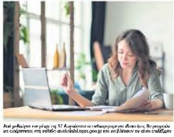
Μια μεγάλη επιλογή για 17 ετήσιες μηνιαίες πληρωμές που ξεκινάει τον Ιούνιο. Το πρόγραμμα να συγχρηματοδοτείται από τον Επενδυτικό Ταμείο.