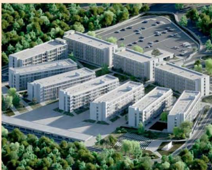
Πιο κοντά φαίνεται πως βρίσκεται η εκκίνηση των έργων στη Κρήτη, όπου ανάδοχος είναι ο όμιλος Ακτορ. Συνολικά θα κατασκευαστούν 1.810 δωμάτια, επί, στο συνολικής δυναμικότητας 2.710 κλινών στην πόλη του Ρεθύμνου και 1.016 διαμερίσματα με 2.136 κλινές στο Ηράκλειο. Στη φωτογραφία, η μελέτη από την εστία του Ηρακλείου.

Άλλο ένα έργο ΣΔΙΤ στην Αττική αφορά και την κατασκευή του πρώτου νεοδомуτού συγκροτήματος φοιτητικών εστιών μετά τη δεκαετία του 1980. Αυτό σχετίζεται με τη δημιουργία 1.100 εστιών για λογαριασμό