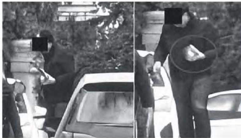
Φωτογραφίες από την έκθεση ανάλυσης της Υπηρεσίας Εσωτερικών Υποθέσεων που έχουν περιληφθεί στη δικογραφία για την υπόθεση διαφθοράς στις πολεοδομίες. Οι συναντήσεις των κατηγορουμένων γίνονταν σε καφετέριες, πάρκινγκ ή έξω στον δρόμο και σε αυτές οι εμπλεκόμενοι φέρεται να εισέπρατταν χρήματα σε φακέλους ή ακόμη και σε κουτιά γλυκών.

Νέοι αποκαλυπτικοί διάλογοι μεταξύ κατηγορουμένων για την υπόθεση διαφθοράς σε πολεοδομίες της Αττικής – Η συνθηματική λέξη «καφές» και οι «επί πληρωμή» εκδόσεις αδειών.