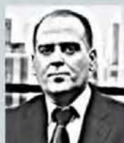
Γράφει ο Λουκάς Γεωργιάδης

Ο ι ενδείξεις για «ταβάνι» στις τιμές των ακινήτων κινητοποιούν χιλιάδες ιδιοκτήτες ακινήτων, οι οποίοι θέλουν να εκμεταλλευτούν τη θετική συγκυρία και να πουλήσουν στη μέγιστη δυνατή τιμή.