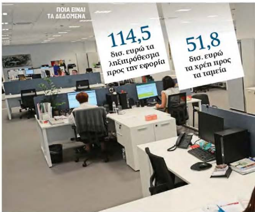
Οι 72 δόσεις θα καλύπτουν φορολογικά και ασφαλιστικά χρέη που δημιουργήθηκαν έως και 31/12/2023.

με οποιονδήποτε τρόπο, δηλαδή με καταβολή από τον οφειλέτη, ή μέσω διοικητικών ή αναγκαστικών μέτρων είσπραξης, όπως το αποδεικτικό ενημερότητας και η κατάθεση, ή διενέργειας συμφηφισμού κατά τις διατάξεις του άρθρου 75 του ΚΕΔΔ, ο οφειλέτης επιβαρύνεται με τον τόκο που αναλογεί στον αριθμό δόσεων που τελικά διαμορφώνεται κατά την ημερομηνία εξόφλησης της ρύθμισης, λαμβάνοντας υπόψη την ημερομηνία υπαγωγής σε αυτή. ● Η ρύθμιση κινείται με συνέ-