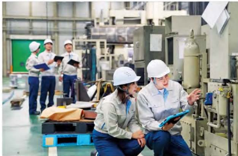
Ενεργειακές δραστηριότητες και υποδομές στρατηγικής σημασίας περιλαμβάνονται στα business plans των κατασκευαστικών ομίλων.

Σε αυτό το πλαίσιο ενισχύεται και η συνεργασία με την Airbus, με το «βλέμμα» στο πρόγραμμα οπτικοακουστικού τηλεπικοινωνιακού δορυφόρου, έργο που συνδέεται με το ευρωπαϊκό πρόγραμμα SALE και εκτιμάται κοντά στα 400 εκατ.