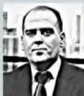
Γράφει ο Λουκάς Γεωργιάδης

Α κόμη και έως μισό διαμέρισμα ή μία ολόκληρη γκαρσονιέρα κερδίζουν οι τυχεροί δικαιούχοι του προγράμματος «Σπίτι μου II», καθώς το όφελος από τους τόκους των δανείων είναι... προκλητικό!