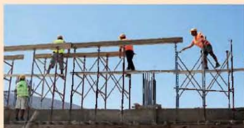
Η υλοποίηση των έργων που χρηματοδοτούνται από το Ταμείο Ανάκαμψης τροφοδοτεί τη ζήτηση για εργατικό δυναμικό κυρίως σε κλάδους έντασης κεφαλαίου, όπως οι κατασκευές και οι υποδομές.

Αναλυτικά, στο βασικό μακροοικονομικό σενάριο, η ανεργία εκτιμάται ότι θα διαμορφωθεί