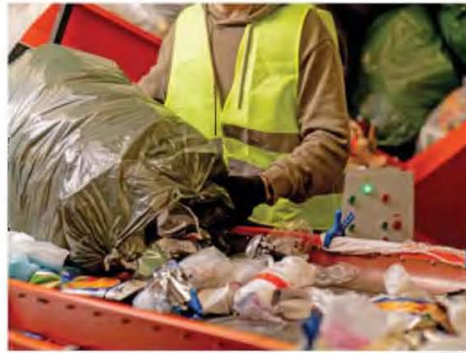
Το έργο αφορά τη δημιουργία δύο πλήρως καθετοποιημένων εγκαταστάσεων διαχείρισης αποβλήτων, σε Χαλκίδα και Λαμία.