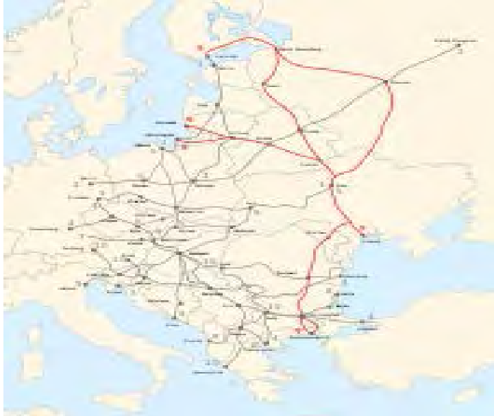
Χάρτης 3.: Πανευρωπαϊκός Διάδρομος ΙΧ

Ο πίνακας που ακολουθεί αποτυπώνει, συνολικά, τις βασικές οδικές αρτηρίες που διατρέχουν τη Ρουμανία, καθώς επίσης και το ποσοστό κατά το οποίο έχει προχωρήσει η κατασκευή τους 5 . Περισσότερες λεπτομέρειες για συγκεκριμένα έργα που έχουν προκηρυχθεί προς το σκοπό της ολοκλήρωσης κατασκευής αυτοκινητοδρόμων και της αναβάθμισης των σχετικών δικτύων παρατίθενται σε ειδικό παράρτημα στο τέλος της μελέτης (Παράρτημα Ι):