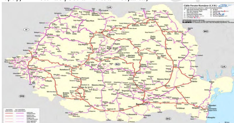
Χάρτης 1.: Αποτύπωση Οδικών Δικτύων Ρουμανίας

Στη Ρουμανία, τα σιδηροδρομικά δίκτυα είναι στην πλειοψηφία τους απαρχαιωμένα και χρήζουν αναβάθμισης.