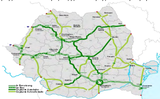
Χάρτης 4.: Αποτύπωση εξέλιξης υλοποίησης αυτοκινητοδρόμων

(Με διγράμμιση αποτυπώνονται οι αυτοκινητόδρομοι που είναι σε λειτουργία, με διακεκομμένο πράσινο οι υπό κατασκευή, με έντονο πράσινο οι υπό σχεδιασμό αυτοκινητόδρομοι και με ελαφρύ πράσινο οι δρόμοι ταχείας μετακίνησης )