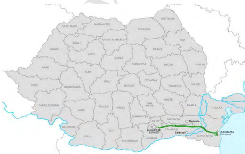
Χάρτης 2. Αυτοκινητόδρομος A2: Bucuresti - Constanta

Σημειώνεται πως προέκταση του αυτοκινητοδρόμου A1 προς Μαύρη Θάλασσα είναι ο αυτοκινητόδρομος A2 που ξεκινά από Βουκουρέστι και καταλήγει στην Κωσταντζα, ο οποίος είναι επίσης ολοκληρωμένος.