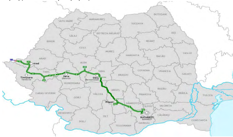
Χάρτης 1. Αυτοκινητόδρομος A1 Arad - Bucuresti

Μετά το Sibiu, το οδικό δίκτυο διέρχεται από την πόλη Deva. Ο αυτοκινητόδρομος Sibiu - Deva είναι ολοκληρωμένος. Το τμήμα του αυτοκινητοδρόμου A1 που ενώνει τις πόλεις Deva και Lugoj, έκτασης 47,31 χμ είναι υπό κατασκευή. Οι εταιρίες που έχουν αναλάβει τα τρία υποέργα του αυτοκινητοδρόμου Deva - Lugoj είναι οι εξής: οι ιταλικές SALINI IMPREGILO S.P.A. και S.E.C.O.L (υποέργο 2), η κοινοπραξία S.C. TELOXIM CON S.R.L. – COMSA S.A. – ALDESA CONSTRUCCIONES S.A. – S.C. ARCADIS EUROMETUDES S.A. (υποέργο 3) και οι S.C. TEHNOSTRADE S.R.L. – S.C. SPEDITION UMB S.R.L. (υποέργο 4). Μεταξύ των πόλεων Lugoj και Arad, ο αυτοκινητόδρομος είναι πλήρως λειτουργικός.