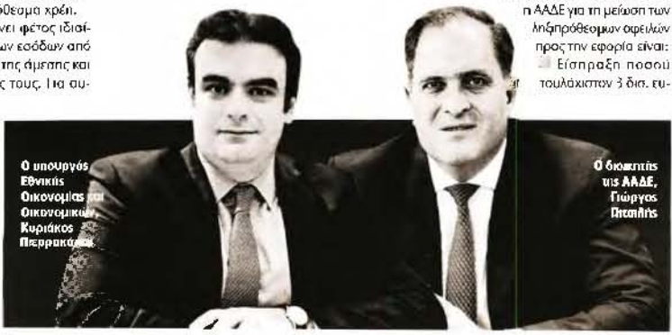
Ο υπουργός Εθνικής Οικονομίας και Οικονομικών Κυριάκος Πιερρακάκης