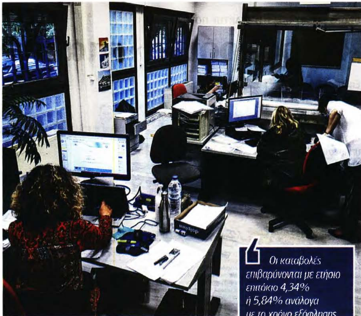
Μέσω της πάγιας ρύθμισης μπορούμε να εξοφλήσουμε τις οφειλές σε βάθος δύο ετών.

Από την ιστοσελίδα αυτή, ο φορολογούμενος πρέπει να επιλέξει κατά σειρά «Πολίτες», «Αίτηση ρύθμισης οφειλών» και «Είσοδος στην εφαρμογή». Στη συνέχεια