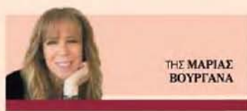
THE MARIAS BOUFANA