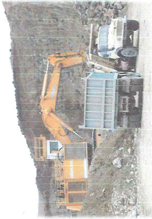
KAMENOLOM GREBEN KAKANJ