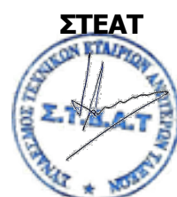
Ο Πρόεδρος Γ. Συριανός