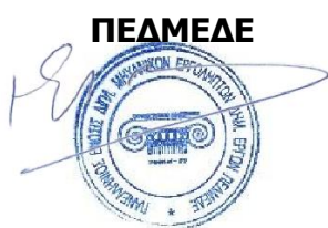
Ο Πρόεδρος Κ. Γκολιόπουλος