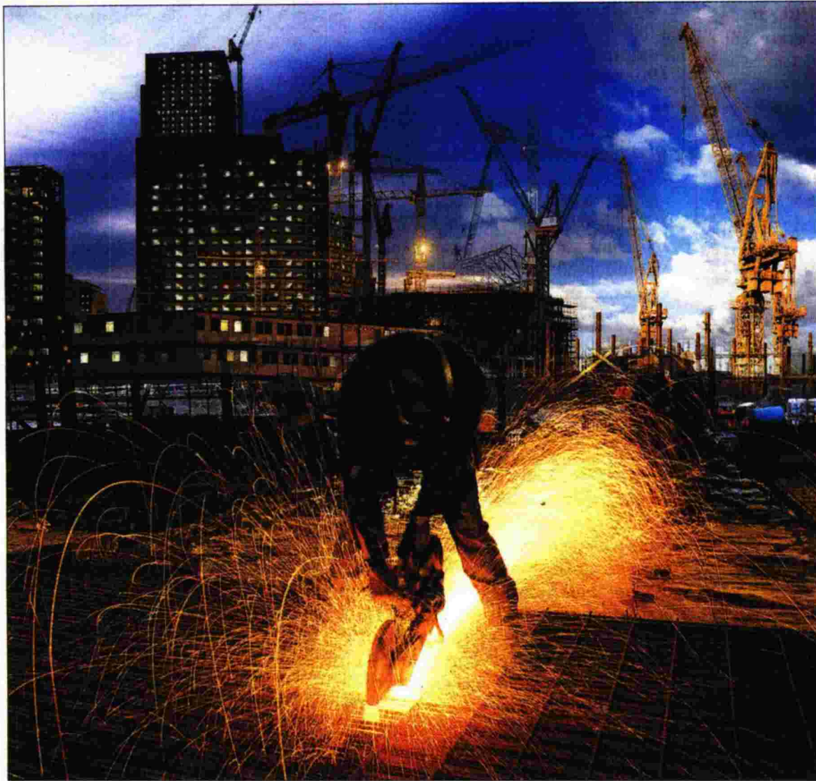
Νέοι παίχτες επιχειρούν να μπουν στο κλειστό κλαμπ των ισχυρών εργολάβων που αναλαμβάνουν δημόσια έργα

Ξαναμοιράζεται η τράπουλα για τα δημόσια έργα μετά τις πρόσφατες νομοθετικές αλλαγές και δέλεαρ τα κονδύλια του ΕΣΠΑ. Ο συνασπισμός των μικρών της αγοράς για ενιαίο σχήμα και η επιστροφή των «παλιών»