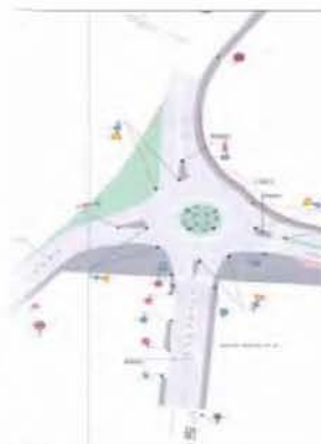
Για την περίπτωση ανασχεδιασμού του κόμβου στον Άγιο Ιωάννη Χωστό προβλέπεται ο επαναπροσδιορισμός των φορών κατεύθυνσης των οδών που συμβάλλουν σε αυτόν.

Οι συγκεκριμένες παρεμβάσεις αναμένεται να ανακουφίσουν σημαντικά περιραιοίους, οδηγούς και πεζούς των παραπάνω περιοχών. Το σχέδιο της δημοτικής Αρχής θα κατατεθεί προς έγκριση στο επόμενο Δημοτικό Συμβούλιο, ενώ οι αριστικές μελέτες, οι εγκρίσεις και τα τεύχη δημοπράτησης εκτιμάται ότι θα έχουν ολοκληρωθεί εντός του έτους.