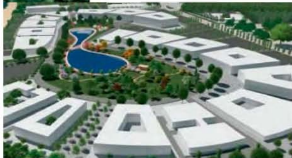
Προσφυγή και κατά του πρώτου πάρκου καινοτομίας της χώρας, του Thess INTEC, με αιτιολογία ότι δεν προστατεύεται επαρκώς ο υγρότοπος του Ελους της Περαίας

συνθήκων, συνυπολογίζοντας τις ποσότητες ζωής κατοίκων και επισκεπτών. Έργο δύσκολο και απαιτητικό τεχνικά, που (ο εκσυγχρονισμός) τη σημερινή ανατολική εσωτερική περιφερειακή οδό σε μήκος 12 χλμ., με την κατασκευή μιας υπερυψωμένης λεωφόρου ταχείας κυκλοφορίας 7,6 χλμ. πάνω από τη σημερινή ανατολική περιφερειακή οδό, που θα περιλαμβάνει και μια γέφυρα 4 χλμ.