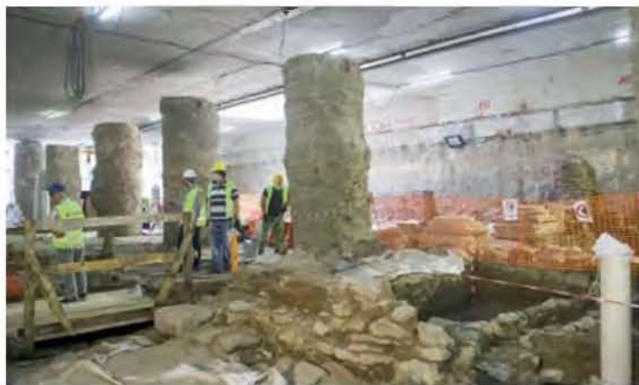
Από το 2006 ξεκίνησε η αλυσίδα των προσφυγών για το μετρό, που επρόκειτο να παραδοθεί το 2012, τελικά όμως θα κόψει ισιωτήρια φέτος τον Νοέμβριο