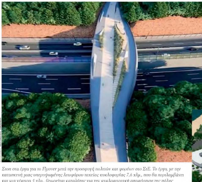
Στοιχ στα έργα για το Flyover μετά την προσφυγή πολιτών και φορέων στο ΣτΕ. Το έργο, με την κατασκευή μιας υπερυψωμένης λεωφόρου ταχείας κυκλοφορίας 7,6 χλμ., που θα περιλαμβάνει και μια γέφυρα 4 χλμ., θεωρείται καταλύτης για την κυκλοφοριακή αποφόρτιση της πόλης

Δεν υπάρχει ανάλογο προηγούμενο σε προηγμένη χώρα με αυτό της Θεσσαλονίκης όσον αφορά τις καθυστερήσεις τέτοιας σημασίας έργων, για τις οποίες ευθύνονται ομάδες πολιτών, αρχαιολόγοι, τοπικοί σύλλογοι, οικολόγοι, η Ορθολογική Εταιρεία, ακόμη κι ένας μπροποκάτης! Καμιά η σημασία των επιστημονικών γνωματεύσεων πανεπιστημίων, ινστιτούτων, ερευνητικών φορέων, όλων των σχετιζόμενων ειδικών για τους περιβαλλοντικούς, κατά κανόνα αλλά όχι μόνο, όρους εκτέλεσης ενός έργου. Υπάρχει η «βιομηχανία των προσφυγών» που μπορεί να ακριβάζεται πάντα. Άρρηκτα προσφυγήσαν θεωρούν ότι έχουν έννομο συμφέρον, ακόμη και όταν δεν είναι ειδικό, αλλά απλώς εκπροσωπούν τοπικά μικροσυμφέροντά ή ακόμα