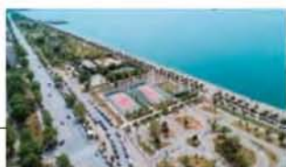
Ακόμα και για το έργο της ανάπλασης της Νέας Παραλίας Θεσσαλονίκης, το οποίο οι ντόπιοι καμαρώνουν και απολαμβάνουν μαζί με τους τουρίστες, υπήρξε η... απαραίτητη προσφυγή 200 κατοίκων της περιοχής. Και μισρεί το ΣτΕ να την απέρριψε, η πολύμηνη καθυστέρηση, όμως, υπήρξε