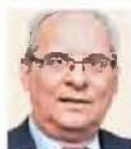
ΤΟΥ ΣΤΡΑΤΟΥ ΠΑΡΑΔΙΑΣ