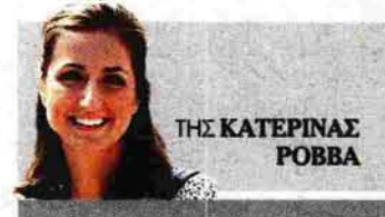
ΤΗΣ ΚΑΤΕΡΙΝΑΣ ΠΑΠΑ

ο οποίος αποτέλεσε την «εικόνα» του σχολείου σε κάθε γωνιά της Ελλάδας. Για να καταλήξει σε αυτόν ο Έλληνας νομομαχικός είχε προηγουμένως ζητήσει από τα υπουργεία Παιδείας της Γαλλίας και της Αγγλίας να του στείλουν πολυάριθμα σχέδια σχολικών μονάδων, τα οποία έλαβε υπόψη του πριν καταλήξει στον χαρακτηριστικό νεοκλασικό