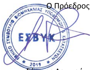
Ο Πρόεδρος Σέργιος Λαμπρόπουλος